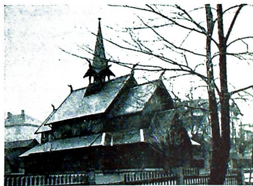
Vor Frue Kirke i Porsgrunn ble reist i 1899 etter tegning av arkitekt H. Børve og mens pastor Blom var sokneprest i byen.

Ennskjønt en ikke a priori kan utelukke nye metoder bare fordi de er nye, er det likevel, for såvidt det gjelder den kunstige befruktning, ikke bare anbrakt å være ytterst reservert, men man må absolutt avvise den. Det vil for øvrig ikke si at man nødvendigvis forbyr bruken av visse kunstige midler som utelukkende er ment enten til å lette den naturlige akt eller for at den naturlige akt, normalt fullbyrdet, kan nå sitt mål.