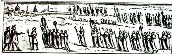
Ved jubelåret 1650. Broderskapene i prosesjon.

Dette er fjellet. Norges vidunderlige, ville og harde fjelltrakter. Nasjonalfølelsen blander seg med en inderlig takk til Gud, som har skapt alt dette skjønne. Jeg elsker dette. Fjellet er det vakreste jeg vet!