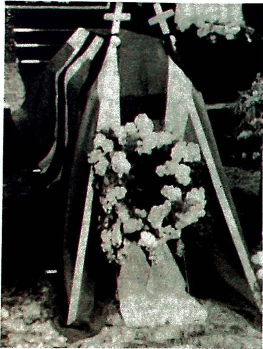
H. M. Kongens krans.