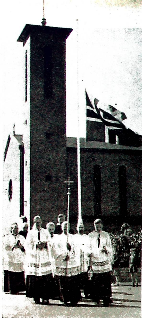
Presteskapet med ministranter fra Hamar i prosesjon foran båren.

det skjønneste monument over hennes livsverk, og det er til trøst og glede for de nålevende og etterslekten.