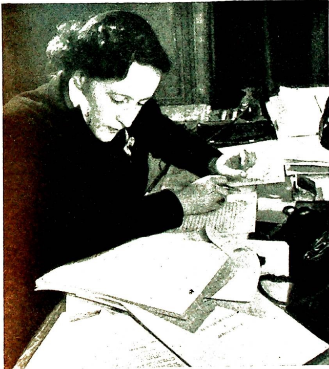
BARBARA WARD. I presse eller radio eller på talerstolen: alltid i ilden, våken og intelligent.

Barbara Ward, nasjonalpresident for den katolske kvinneliga, sa på vegne av de engelske katolske kvinner bl. a.: «Jeg føler trang til å tale, ikke bare til katolske kvinner, men til kvinner over hele verden som anerkjenner menneskerettighetene. Kardinalen ble dømt fordi han hadde forsvart menneskets rettigheter og da særlig de