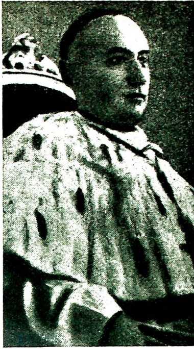
Den 56 år gamle kardinal Joseph Mindszenty, fyrstprimas av Ungarn.

lutheranere energisk protesterte. Alt tidligere hadde regjeringen tatt skritt til å forvandle de kirkelige, politiske og sosiale ungdomsorganisasjoner til rent kommunistiske «pionergrupper».