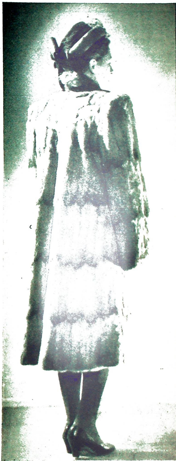
Originalfotografi av kåpen.