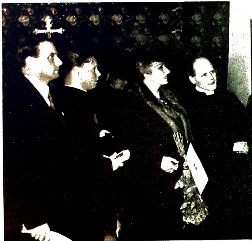
Kronprinsessen beser utstillingen.