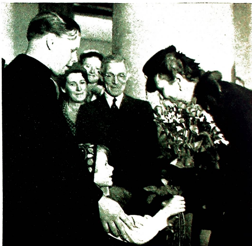
Ulrikke Greve overrekker Kronprinsessen blomster.