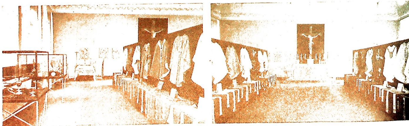
Fra den liturgiske utstilling.

uten tvil et tiltak hvis virkninger vil spores inn i framtiden og ikke bare bli stående ved den øyeblikkelige suksess. Under landsmøtet ble det fra mange