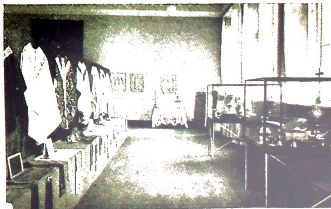
Fra den liturgiske utstilling.