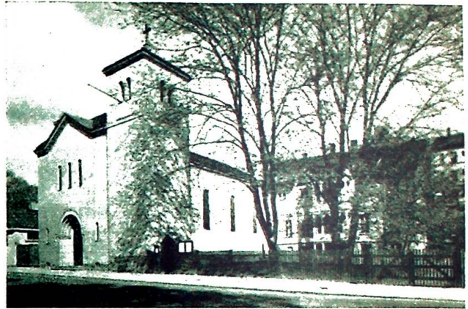
St. Dominikus kirke av i dag.

lyktes det å skaffe midler til å reise den vakre St. Dominikus kirke som nå står. Grunnsteinen ble lagt i 1926, og sammen med den også en sten fra dominikanernes gamle kloster i Oslo, St. Olavsklostret, — nok en brusten tråd ble knyttet. Innskriften på kirkeklokken (som var en gave fra franske venner) minnet om det nye klostrets to grunnleggere: