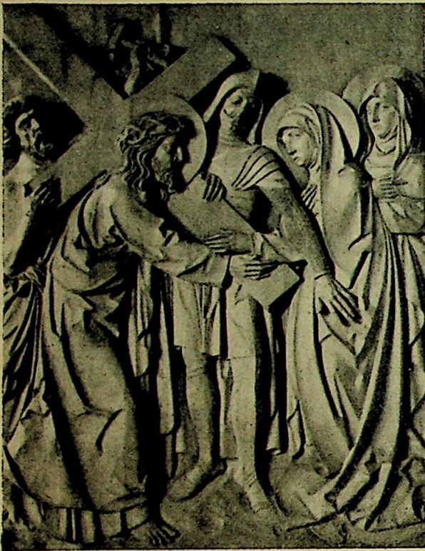
4. stasjon: Jesus møter sin hellige mor.