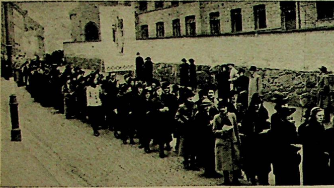
Jubileumsprosesjonen i Oslo, påskelørdag.