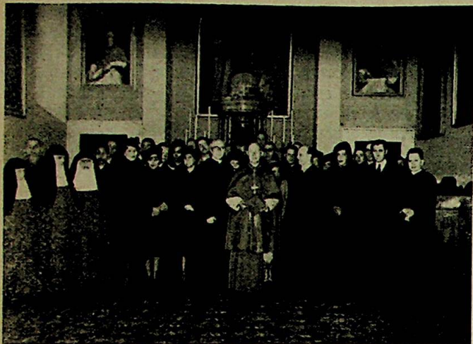
Fra jubileumsmessen i Roma.