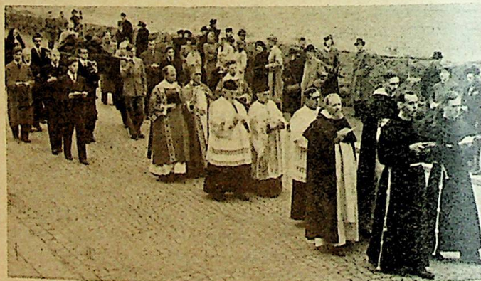
Også fra samme prosesjon.