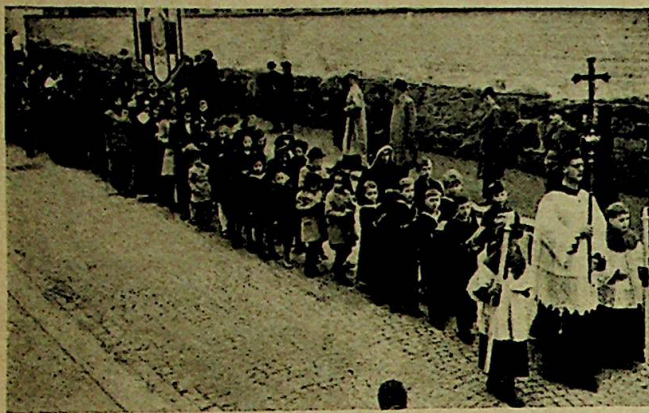
Fra prosesjonen i Oslo.

hele koret inn til Oslo for å gi en konsert her, visste vi at vi hadde noe å glede oss til, hvilket bl. a. gav seg utslag i et fullstendig run på billettsalget da dette ble åpnet. I løpet av noen få formiddagstimer kunde det meldes alt utsolgt, og St. Dominikuskirken var da konserten begynte så overfylt som det går an å være.