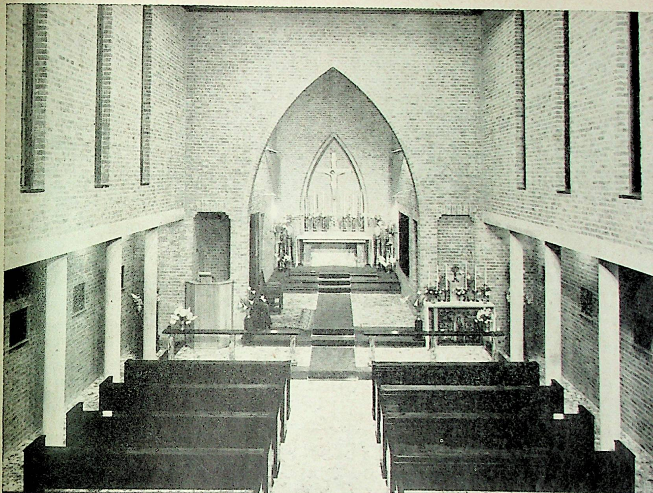
St. Torfinnskirkens interior.