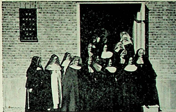
Sostre foran kirken.

Aftenandakten blev holdt av sogneprest van der Vlugt og hadde ogsa samlet en overfylt kirke. I sin tale nevnte pastoren at den nye evighetslampe, som nu var tendt, bragte bud om at «Mesteren er her og kaller pa oss». Kristus i sakramentet er kirkens og menighetens midtpunkt og vare hjerter skulde brenne som evige lamper av kjarlighet til