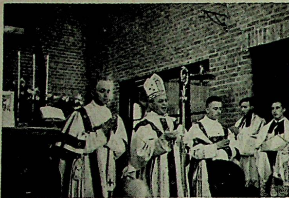
Biskopen av Selja taler.