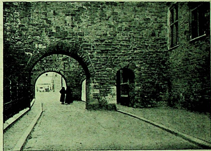
Onder de Boogen — inngangen til Moderhuset i Maastricht

I selve revolusjonsåret 1789 så kongregasjonens grunnlegger verdens lys. Som hushjelp kom hun til Maastricht, og så her på sine byturer ruinene av