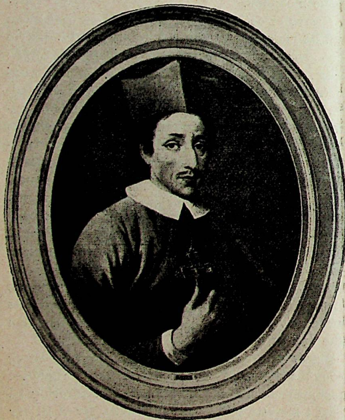
Biskop Nicolaus Steno.

«Nordisk Ugeblad» har utsendt et mønstergyldig festnummer i anledning 250 års dagen for den store danske konvertitt Niels Steensens død. Heftet, hvis allsidig redigerte innhold på en sjelden fyldig måte tegner et fullstendig bilde av den store lærde forskers og den fromme og ydmyke kristens liv ut fra innstillingen: