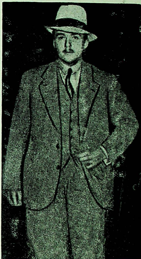
Erkehertug Otto av Habsburg. (Fotografert under sitt ophold i Oslo.)

«Briefe aus der Verbannung» later ingen plass mulig for tvil — svaret er så absolutt som det kan bli: «Det har aldri vært noen lett opgave å være keiser av Østerrike. Men det er en hellig plikt, som ligger hinsidig om man føler ærgjerighet eller glæde eller lede ved den. Den østerikske trone er min — Østerrike er mitt. Ved mine forfedre har jeg mottatt den opgave å skulde bevare dette Østerrike og opprettholde med Guds nåde dette lands sik-