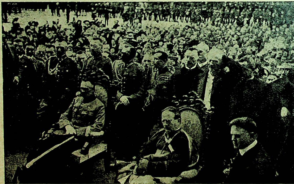
Marskalk Pilsudski med daværende nuntius Ratti, den nuværende pave Pius XI.

«Polens befrier» — «Polens nasjonalhelt» avgikk ved døden søndag d. 12te mai. Det er med rette at verdenspressen har satt disse betegnelser på marskalk Pilsudski, ti ingen av de menn som er trådt frem i offentlighetens lys i det gjenreiste Polen, har spillet den store politiske rolle som han. Gjennem sin veldige innsats for Polens selvstendighet blev han identisk med Polen selv, og i den store almenhets bevissthet var han for Polen hvad Mussolini er for Italien, Horthy for Ungarn og Hitler for Tyskland: redningsmannen ut av uføret. Men i vir-