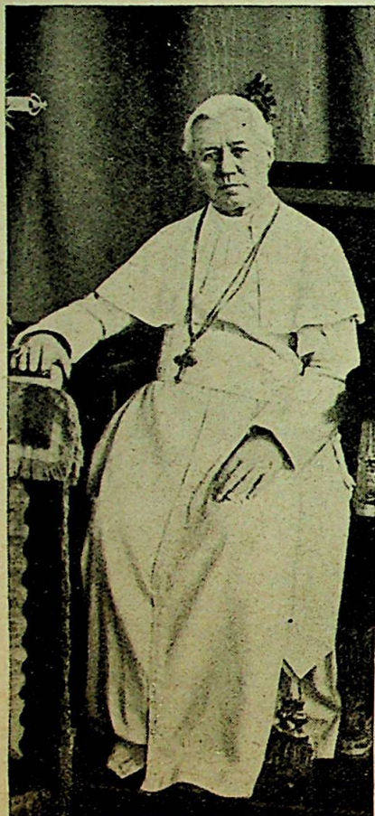
Pave Pius X.