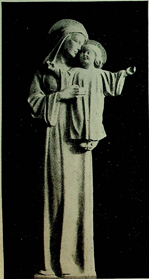
«Barnet med dets mor» (statue av R. de Villiers).

Det er noe konkret og man kan si realistisk ved julens budskap om fred på jorden. Juleevangeliet er ikke vagt og uklart som et slags drømmesyn, det er tvertimot klart og tydelig, man kunde næsten si håndgripelig. Det er ikke en slags høiere gnosis, som kun særlig innviede kan få kunnskap om, skjont det ofte hender at det blir fremstillet slik. Det er et budskap for alle tider og alle folk, uten hensyn til kunnskaper og kulturtrin, det er et budskap som barn kan forstå like godt som voksne. «I skal finne et barn i svøp, liggende i en krybbe», det var under denne skikkelse og på denne måte at menneskenes Frelser kom til verden. Man kunde ha ventet at Frelserens komme til jorden skulde skje med en prakt og en herlighet så stor at den vilde virket betagende og overveldende på menneskene, og så kom han isteden på denne ube-