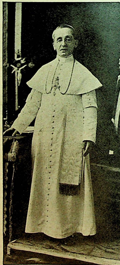
Pave Benedikt XV.

Benedikt XV var i ånd og sannhet det som Wilson gjerne vilde være: fredsstifteren. Og det lykkedes ham å føre Kirkens enhet frelst gjennom den verdensbrand som ellers la så mange verdier øde. Det var en vanskelig og krevende tid, men han kunde overgi sin etterfølger en urokkelig Kirke og selv dø i fred, men med sorgfullt hjerte over dødens herjinger blandt Europas ungdom.