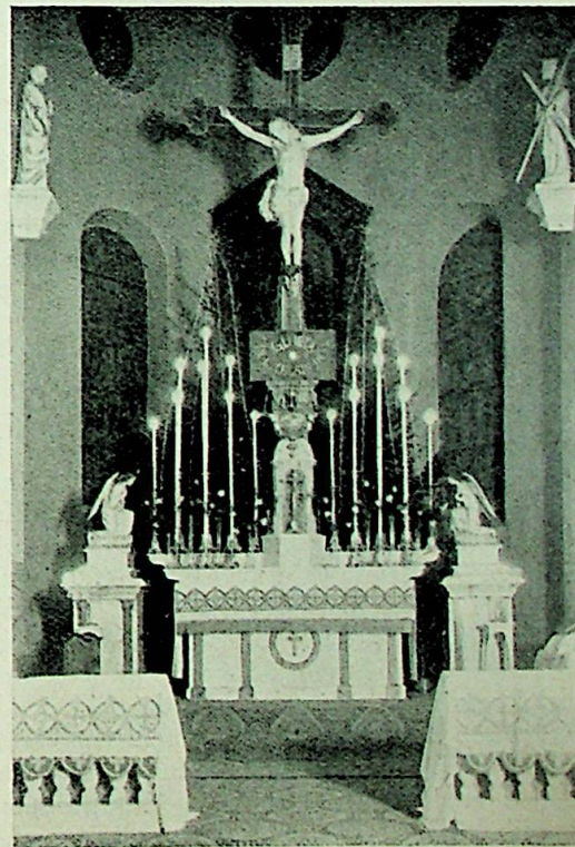
St. Paulskirken i Bergen.