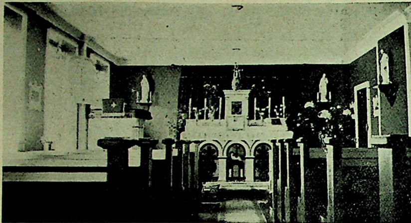
St. Sunniva-kapellet på Molde.