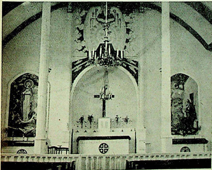
Vår Frue-kirke i Tromsø etter dekoreringsarbeidet.

Den nye superior ecclesiasticus tok straks sitt embede i besiddelse idet den daværende apostoliske administrator i Oslo