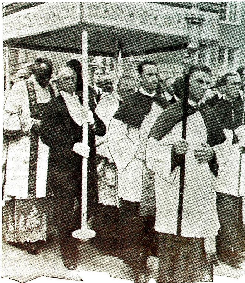
Kardinal van Rossum bærer Sakramentet i den store procesjon.