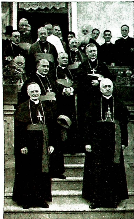
Foran bispeboligen i Valby efter ankomsten. I første rekke kardinal van Rossum og kardinal Hlond.

Om morgenen var der barnegustjeneste i den store Jesu-Hjerte Kirke, som var festlig pyntet og hvor der