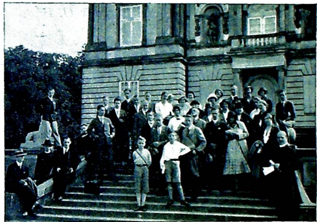
Den norske representasjon foran Ermitageslottet.

Mandag reiste vi fra Kjøbenhavn. Kongressen var forbi og dermed også det pene vær. Vi kom til Helsingør, hvor vi på det hjerteligste blev hilst velkommen av byens prester. Sognepresten viste oss sin vakre kirke, som fikk oss til å beundre hans praktiske og liturgiske sans. Alle kongressens deltagere blev fotografert her — og dernæst beså vi det gamle Mariakloster