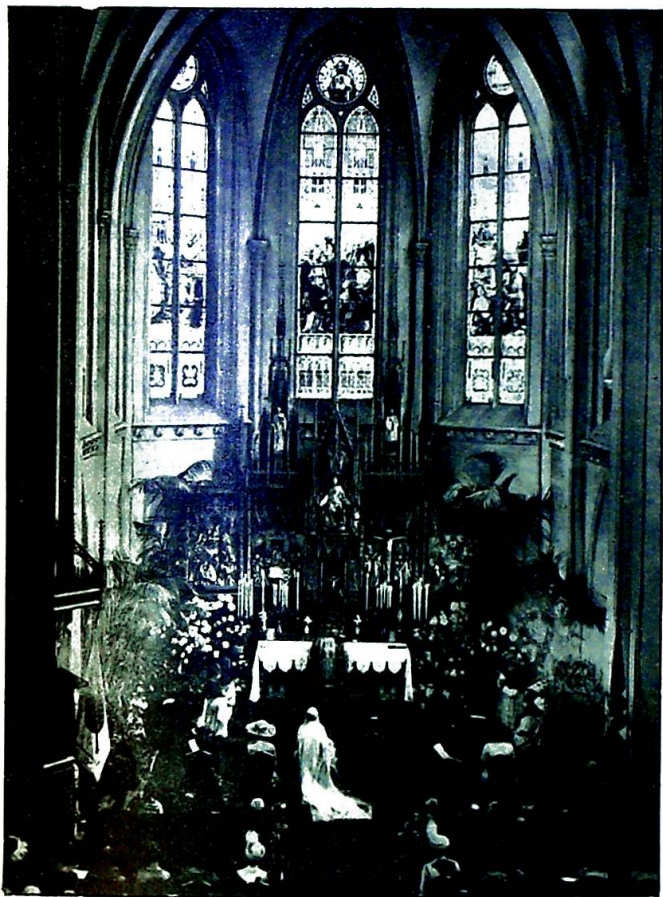
Jesu Hjerter Kirke.

For at prosesjonen kan utvikle sig i ro og orden, vil de forskjellige kategorier av deltagere allerede i Klosterhaven før messen få anvist bestemte plasser. Den foreløpig skisserte plan går ut på følgende: Den celebrerende kardinals trone reises på venstre side av terrassen. På høire side, de øvrige prelater. Rimeligvis an-