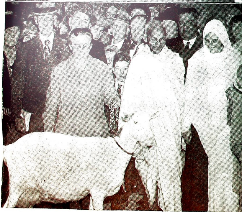
Snapshots fra Gandhi.

grunn til all deres elendighet. De vender sig derfor nu imot dem. «Gå frivillig, eller vi fordriver eder!» — dette rop hører vi nu fra Cap Comorin til den kinesiske mur. Kun kristendommen kan hjelpe her — den store guddommelige kristendom.