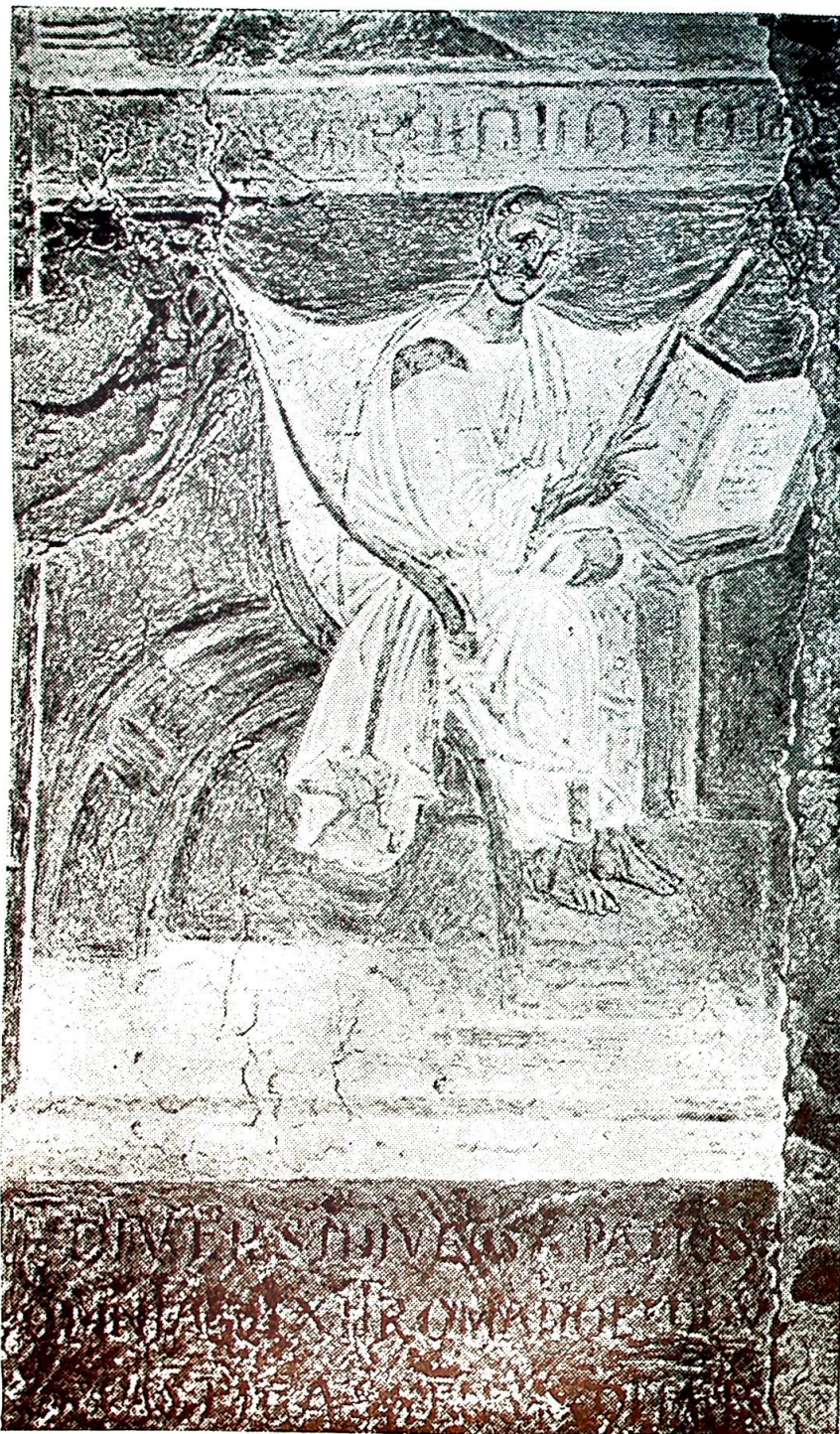
Den lesende Augustinus.

Man må opriktig beklage at Goethe efter sin hjemkomst fra Italien igjen lå under for kvinner. Derved utdypedes kløften i ham og han fjernet sig mer og mer fra det mål, som han dog strepte så ærlig efter. Han følte det selv, og hans mange frivole epigrammer med utfall mot kristendommen må sees i sammenheng med hans indre misfornøielse med sig selv. Han blev fra nu