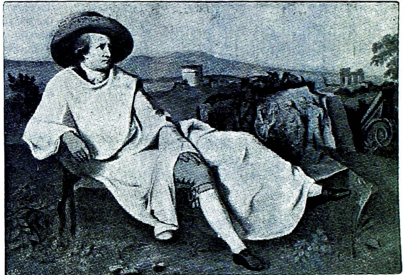
Goethe dvelende i naturen.

manglet de virkelig store religiøst betonte individer i hans omgangskrets. Hans ubegrensede beundring for videnskap og kunst og for alt det almen-kulturelle førte ham mest sammen med representanter for de skjønne videnskaper. Ingen av tidens åndsretninger lot ham uberørt og derved kom der meget direkte forvirrende og antikristelig inn i hans liv. Hans reseptive natur bragte ham i kontakt med biologien, anthropologien, botanikken — han var pedagog og kultusminister, teaterintendant og kunstkritiker. Han malte, graverte, forsøkte sig