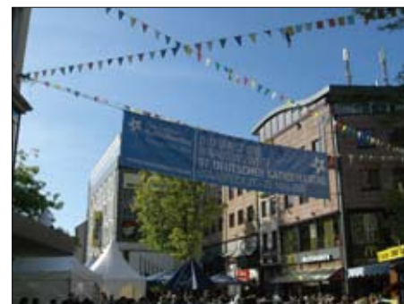
Mottoet for dagene: "Du leder oss ut på dypet".

Kirchenmeile var et kapittel for seg. På et stort område fra jernbanestasjonen til domkirken kunne en se hvite pagodetelt. Her presenterte ca. 240 organisasjoner seg. Programmet ga god oversikt. Vi ruslet rundt der de forskjellige bispedømmene og ordenssamfundene presenterte seg. Bispe-