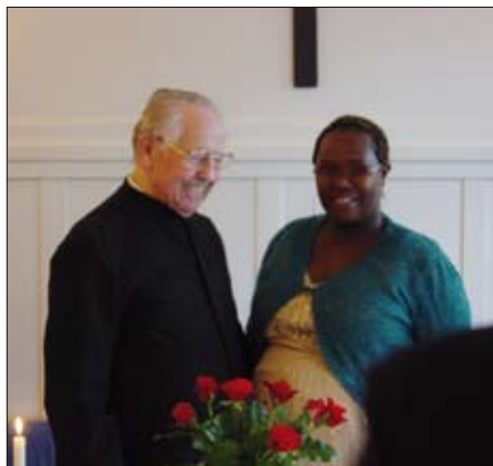
Glimt fra avskjedsfesten.

niske, på sine eldre dager ble en ivrig datamaskinsbruker.