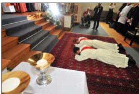
Ordinandene prostrerer under Allehelgenslitaniet.