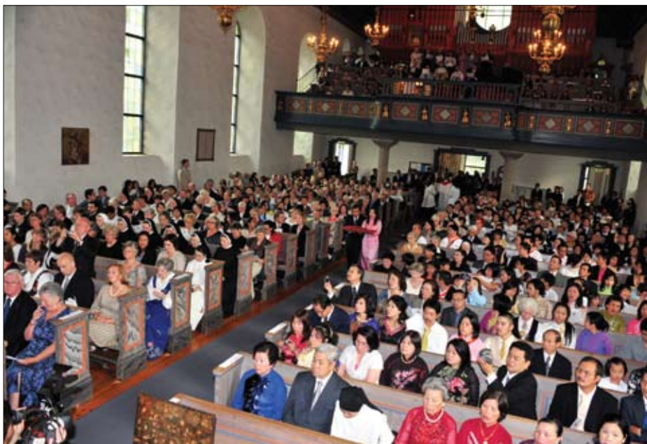
Ris kirke var fullsatt.