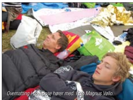
Overnatting i sovepose hører med.

Vårt vertskap i Sydney var menigheten St. Dominikus i utkanten av sentrum. Her ble vi innlosjert i en nedlagt skole. Det var på ingen måte noen luksus, men ingen så ut som at de brydde seg om det. Flere ganger i løpet av turen lurte jeg på hvorfor folk