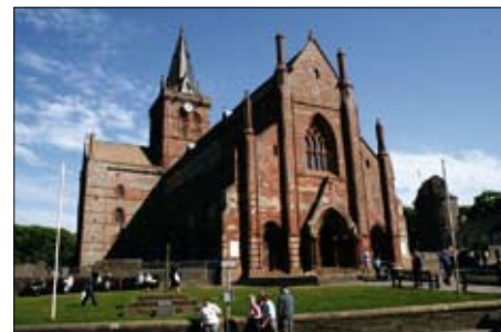
St. Magnuskatedralen i Kirkwall – også kalt "Nordens Lys" – har stått uendret siden 1400-tallet.

Før hjemreisen var det også satt av tid til en rundtur på Mainland, til noen av de bemerkelsesverdige, ca. 5000 år gamle, minnesmerkene fra steinalderen, og ikke minst til ruinene av Earl's Bu og Round Church i Orphir. Her hadde jarl Håkon Pålsson sitt sete fra ca. 1100. Etter at han sørget for å myrde sin fetter Magnus i 1116, dro han på pilegrimsreise til Jerusalem, og ved hjemkosten bygget han Round Church ved siden av den store gildehallen.