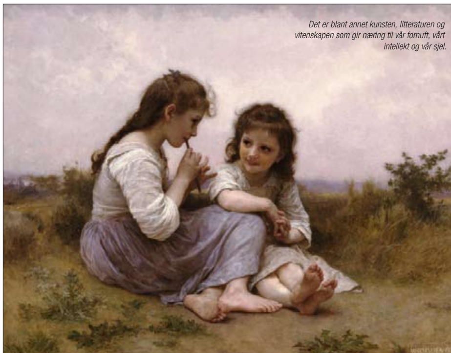
Det er blant annet kunsten, litteraturen og vitenskapen som gir næring til vår fornuft, vårt intellekt og vår sjel.

Det mest i øyefallende hos Jesper Juul er naturligvis i den sterke grad han anvender relasjonsbasert tilnærming