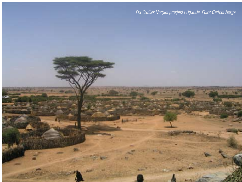
Fra Caritas Norges prosjekt i Uganda.

Caritas Norge har fokus på kvinner og likestilling i år. En av målsettingene på seminaret er derfor å utveksle erfaringer innen arbeid rettet mot kvinner og kjønnsbasert vold, og hvordan vi kan sette dette på dagsorden. Vi tror at forandring må komme fra grasrota. Det er derfor ikke bare mennesker høyt oppe i systemet hos