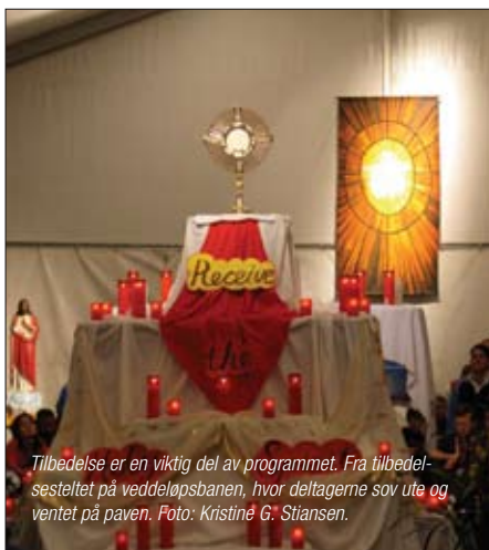
Tilbedelse er en viktig del av programmet. Fra tilbedelsesteltet på veddeløpsbanen, hvor deltagerne sov ute og ventet på paven.