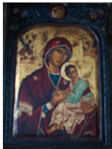
Vår Frue av Evig hjelp, donert til den norske PRT-leirens kapell i Meymaneh.