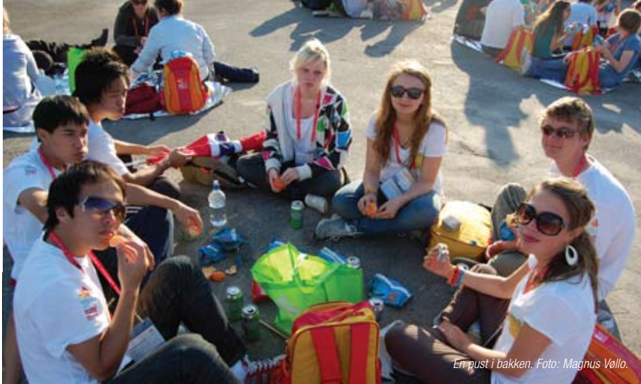
En pust i bakken.