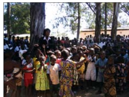
Fra Caritas Norges prosjekt i Zambia.

Vi ønsker også å dele våre partneres erfaringer med andre organisasjoner i Norge. Vi arrangerer derfor et ek-