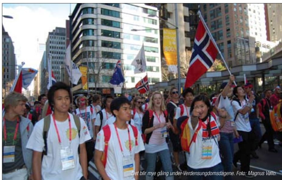
Det blir mye gåing under Verdensungdomsdagene.

Australia er langt unna, men hele 145 unge mennesker fra Norge, inklusive biskop Eidsvig, la ut på den lange reisen til Australia som svar på pave Benedikts invitasjon til all verdens ungdom om å reise nettopp dit som pilegrimer for å feire den tro som samler oss til ett på kryss og tvers av alle landegrensene og kulturer.