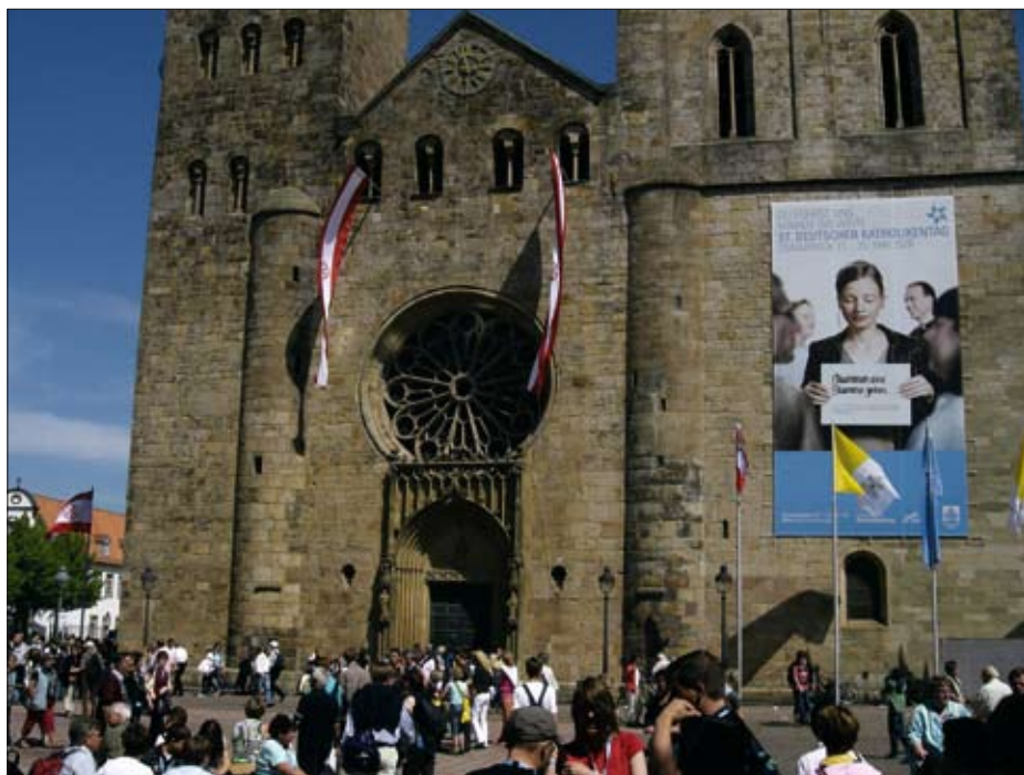
Domkirken i Osnabrück.

gene de mange innvandrerne skapte. Biskopen takket de tyske katolikkene for hjelpen de nordiske landene mottok fra dem.