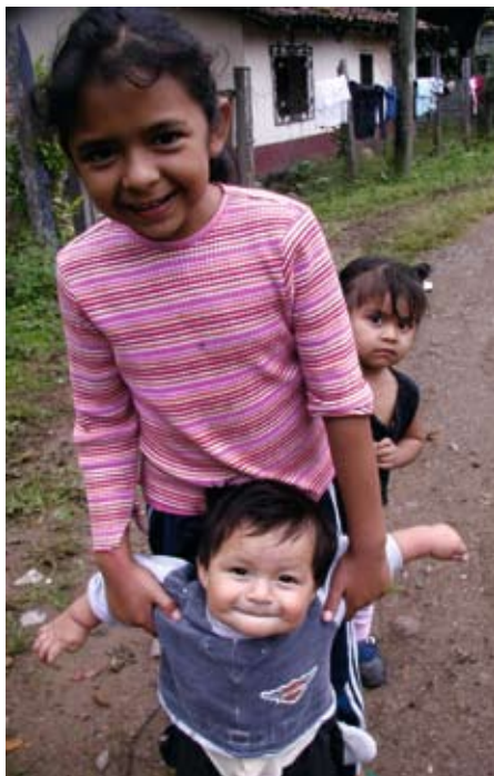
Fra Caritas Norges prosjekt i Honduras.