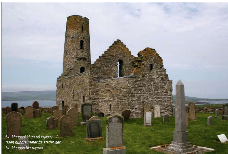
St. Magnuskirken på Egilsay står noen hundre meter fra stedet der St. Magnus ble myrdet.